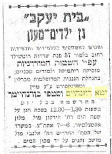
איור 1: עיתון "היום" 20.09.1933